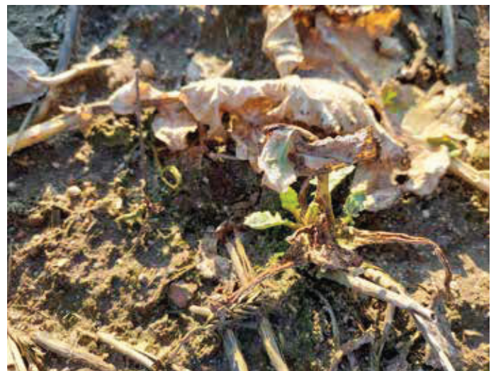
Stark geschädigte Einzelpflanze durch Erdflorbefall.